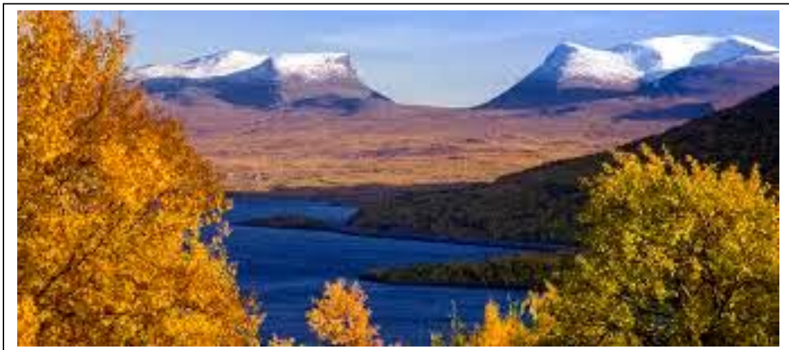
Lapporten/ Tjuonavagge/ Gåsdalen

– Allt är fjärran! Även Evigheten, säger jag och läser högt för henne om mina drag från Gåsdalen: